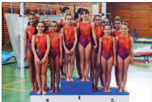
Algunes de les participants del Club

El Club Gimnàstic Lleida col·labora al Consell del Segrià amb 47 gimnastes