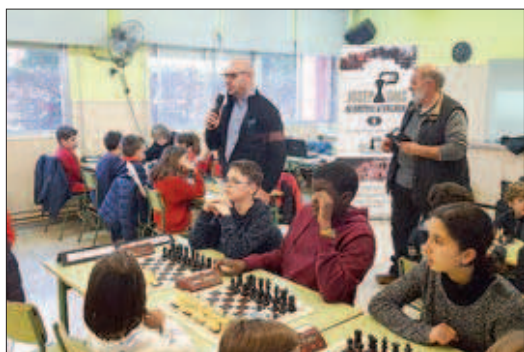
La sisena edició tindrà una alta participació

La sisena Lliga Escolar ADEJO inicia el torneig a l'Escola Països Catalans