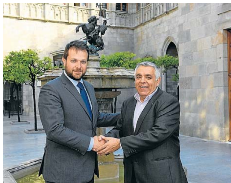
El secretari general de l'Esport, Gerard Figueras, i el president dels Consells Esportius, Jaume Domingo. UCEC

En aquest sentit, tant el secretari general de l'Esport com el president dels Consells Esportius valoren molt positivament els canvis que s'han implantat i la present temporada esportiva dels Jocs. Tots dos han definit l'esport en edat escolar a Catalunya com "un model esportiu que educa i que va més enllà de la simple competició, ja que ajuda a fer bones persones i bons ciutadans i ciutadanes a través de l'esport".