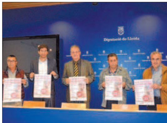
El precio de la inscripción será de dos euros

La competición, que recibe el nombre de Trofeu Diputació de Lleida, constará de siete pruebas que se disputarán en las tres comarcas organizadoras: Cros Esbufecs en Mollerussa (25 de octubre), Cros de Tremp (29 de