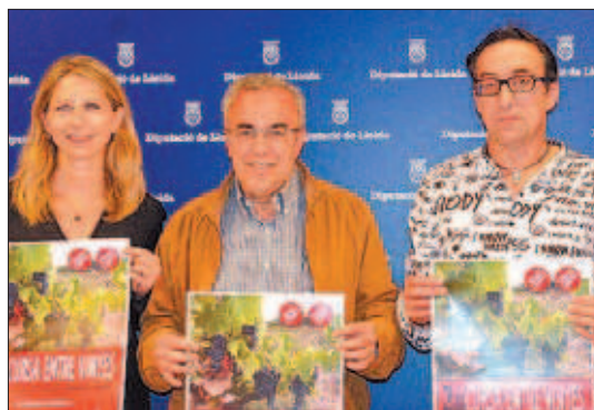
La carrera tiene carácter solidario

La Diputació de Lleida fue el escenario de la presentación, en la que estuvieron el alcalde de